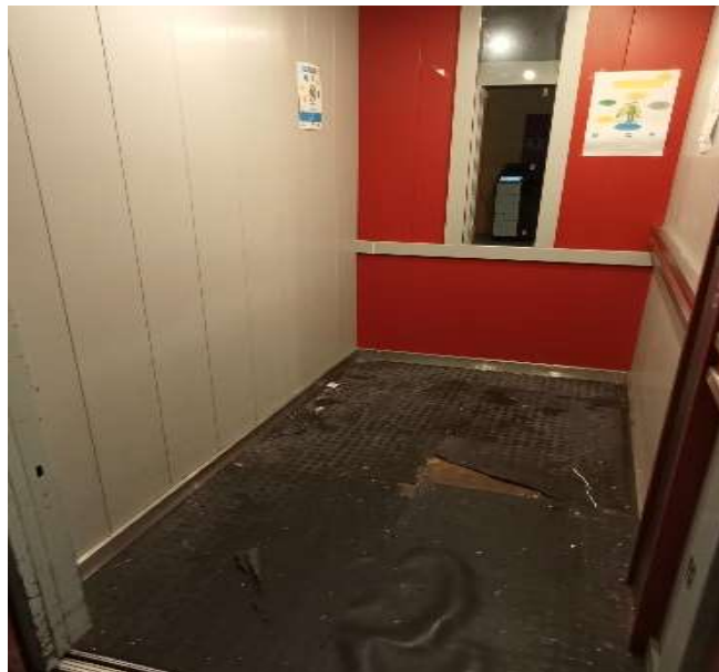
Revêtement nécessitant un remplacement total