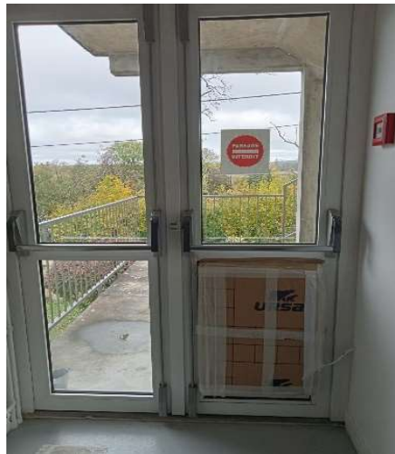
Porte des issues de secours à remplacer

A chaque aile et à chaque étage, les portes de secours bénéficiaient d'un système de désenfumage aujourd'hui non fonctionnel. Des trappes ont été créées dans les portes. Ces dernières communiquant directement avec l'extérieur, nécessitent d'être changées afin de conserver la chaleur dans le bâtiment. Au vu des installations vétustes, il convient de remplacer les 6 portes battantes.