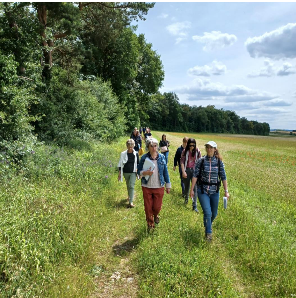
Atelier résilience alimentaire – Juin 2024